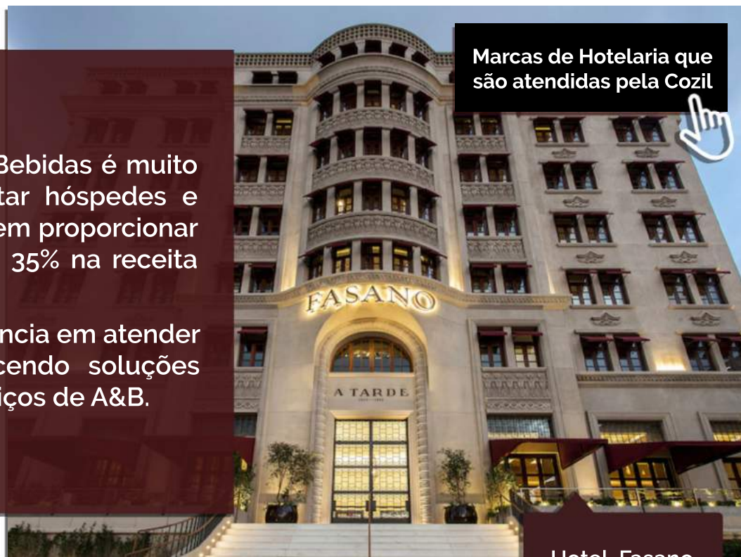
Hotel Fasano Salvador - Bahia

Confira como você pode contar com os equipamentos da Cozil para compor excelentes serviços gastronômicos e agregar ainda mais valor ao seu empreendimento.