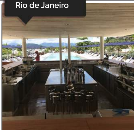
Hotel Fasano Angra dos Reis Rio de Janeiro

Marcas de Hotelaria que são atendidas pela Cozil