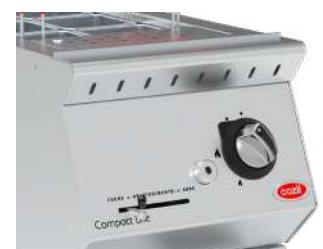
Versão a Gás