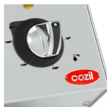
Versão a Gás