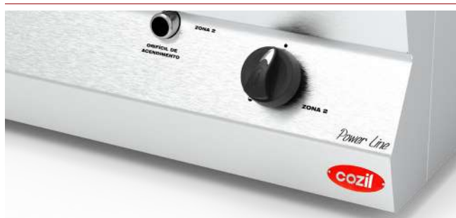
Versão a Gás

Alimentação Elétrica: Tensão 220V ou 380V Trifásico, 60Hz;